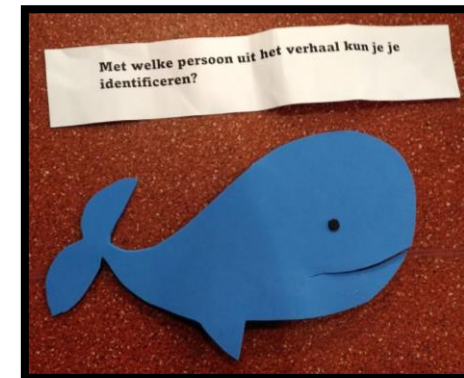
Gespreksstof bij buurtkerk

Er is veel geestelijke honger onder de vluchtelingen. Met name onder de Iraniërs. Veel van onze vaste contacten hebben inmiddels een status ontvangen. En een huis. Meerderen hebben een huis gekregen in (de directe omgeving van) Breda en zijn betrokken gebleven bij de Mattheüskerk. Als vertaler of anderszins als vrijwilliger. Anderen zijn verder weg geplaatst. Hun plaatsen zijn ingenomen door vele anderen die maar vrij kort op het AZC zullen blijven omdat ze daar alleen zijn tot hun interview afgenomen is. Maar hun geestelijke honger is daar niet minder door. We hebben nu 4 mensen die minder dan één maand geleden gedoopt werden in een andere gemeente. Anderen zijn al langer Christen. Weer anderen hebben belangstelling voor het Christelijke geloof maar nog heel weinig kennis. En nog anderen hebben aangegeven dat ze gedoopt willen worden. Te veel werk voor een parttimer. Dus bid alstublieft om meer arbeiders in de wijngaard. En misschien wilt u zelf wel mee dienen en de daden van onze Heere zelf zien. En daarbij ingeschakeld worden.